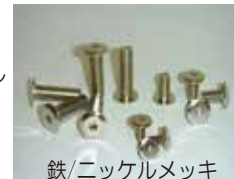
鉄/ニッケルメッキ