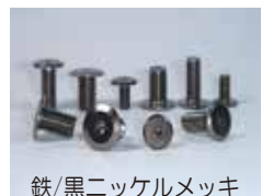
鉄/黒ニッケルメッキ